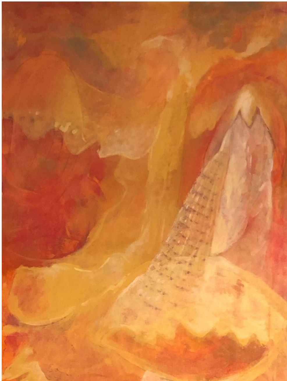
Série « Corps intérieur d'hiver » Peinture acrylique sur toile de lin 2,08m x 1,38m 2022