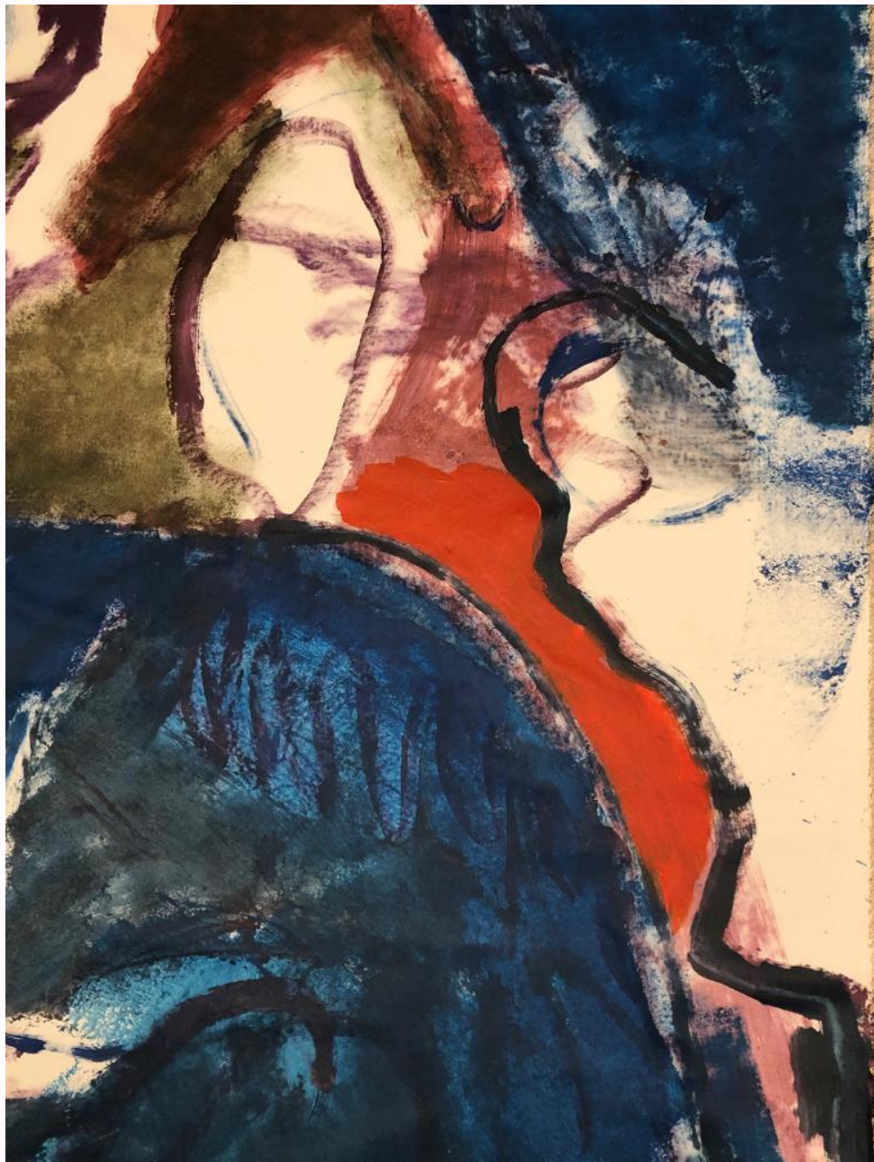
Série « Corps intermédiaires d'Automne » Peinture acrylique sur toile de lin 1,20m x 1,66m 2022