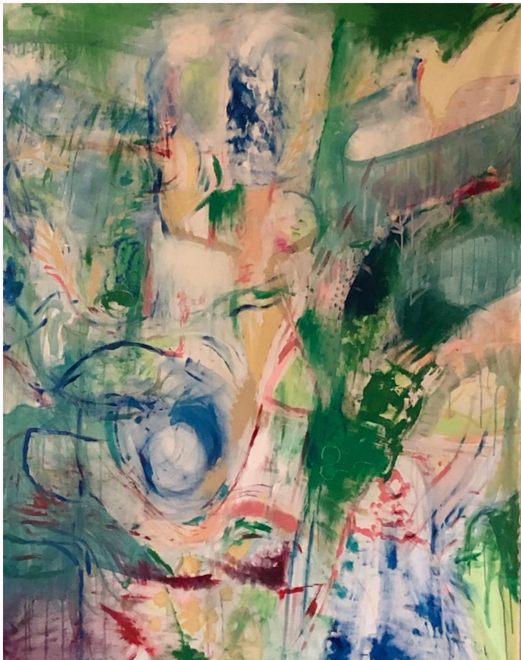
Série « Corps intermédiaires d'Automne » Peinture acrylique sur toile de lin 1,20m x 1,66m 2022