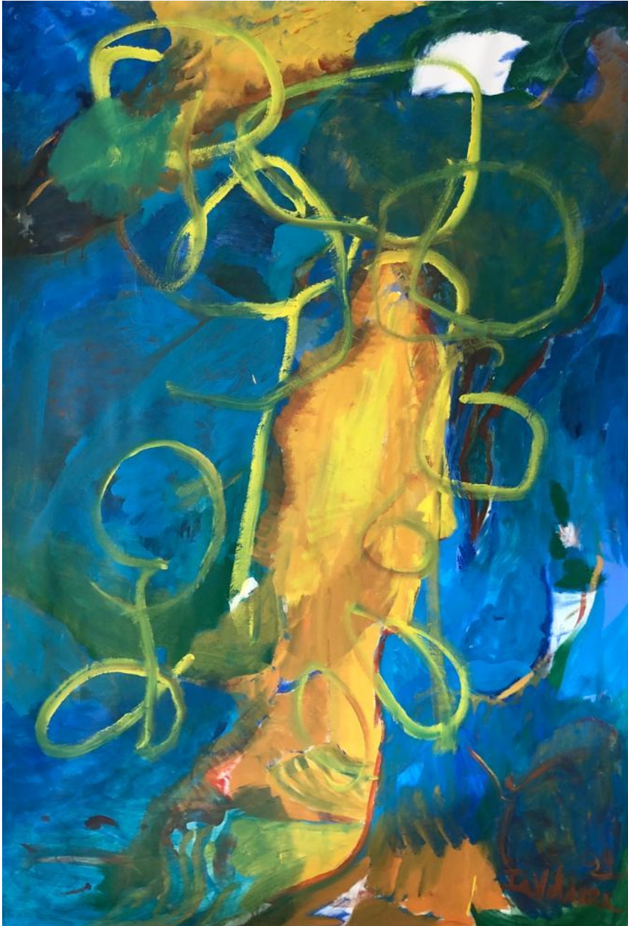
Série « Corps intérieur d'hiver » Peinture acrylique sur toile de lin 2,08m x 1,38m 2022