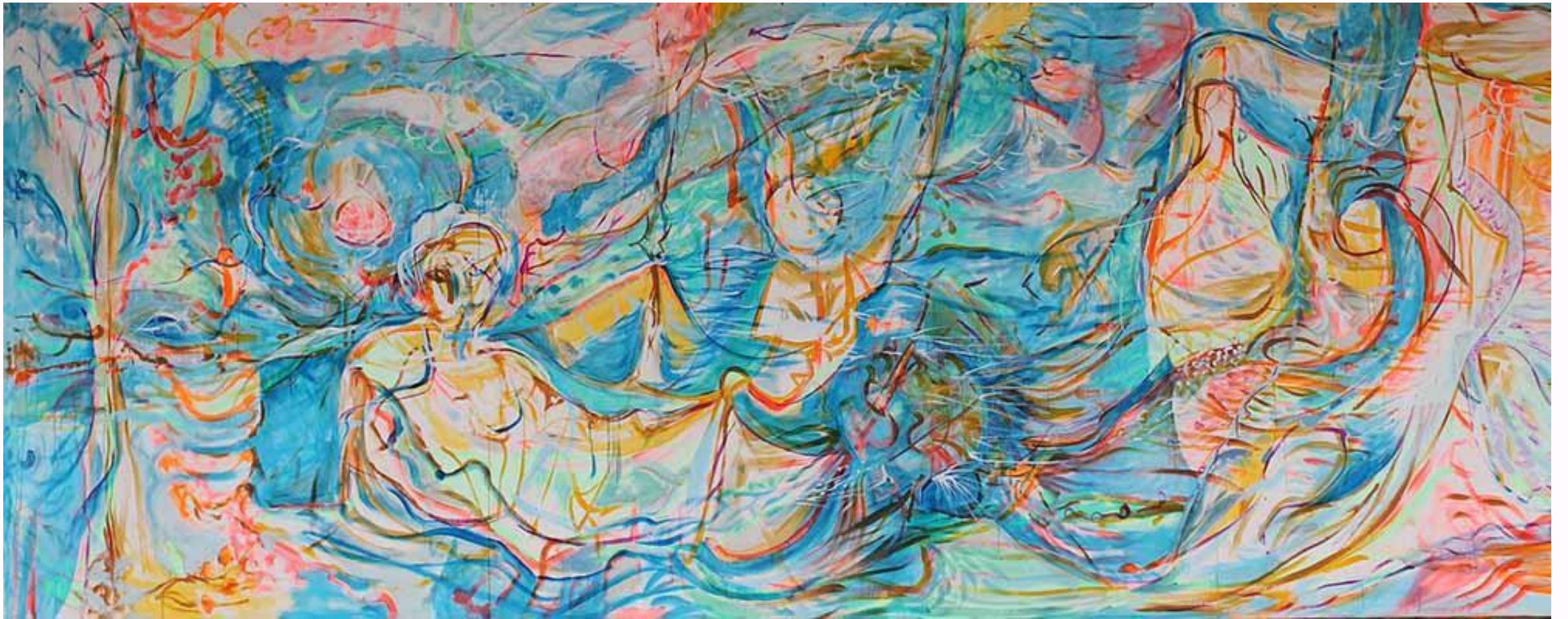
Série « Aquarius V » Peinture Acrylique sur toile de lin 10m x 2m 2015