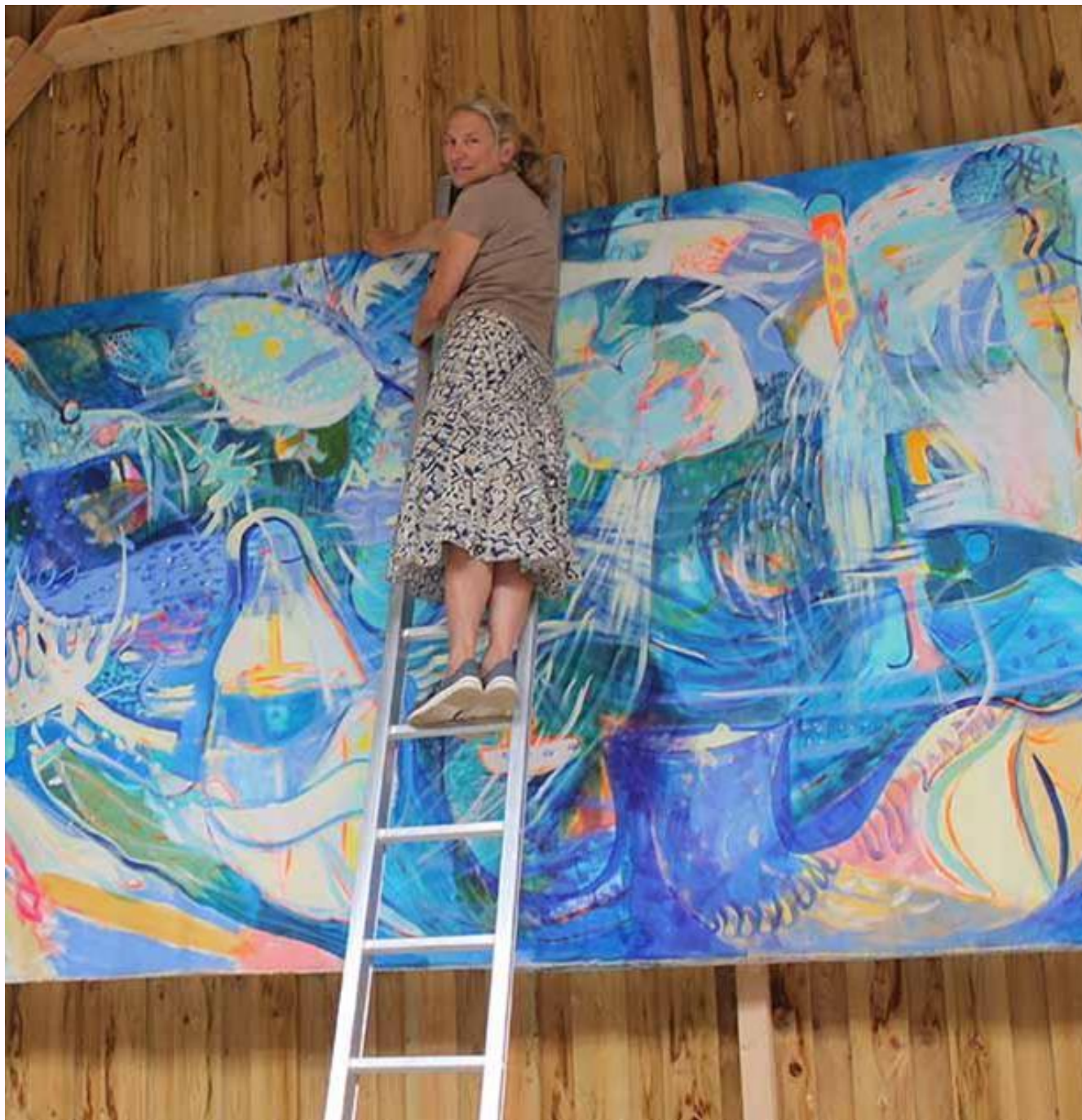
Exposition Musée de la machine agricole Printemps 2015 Saint-Loup-des-Bois 58251