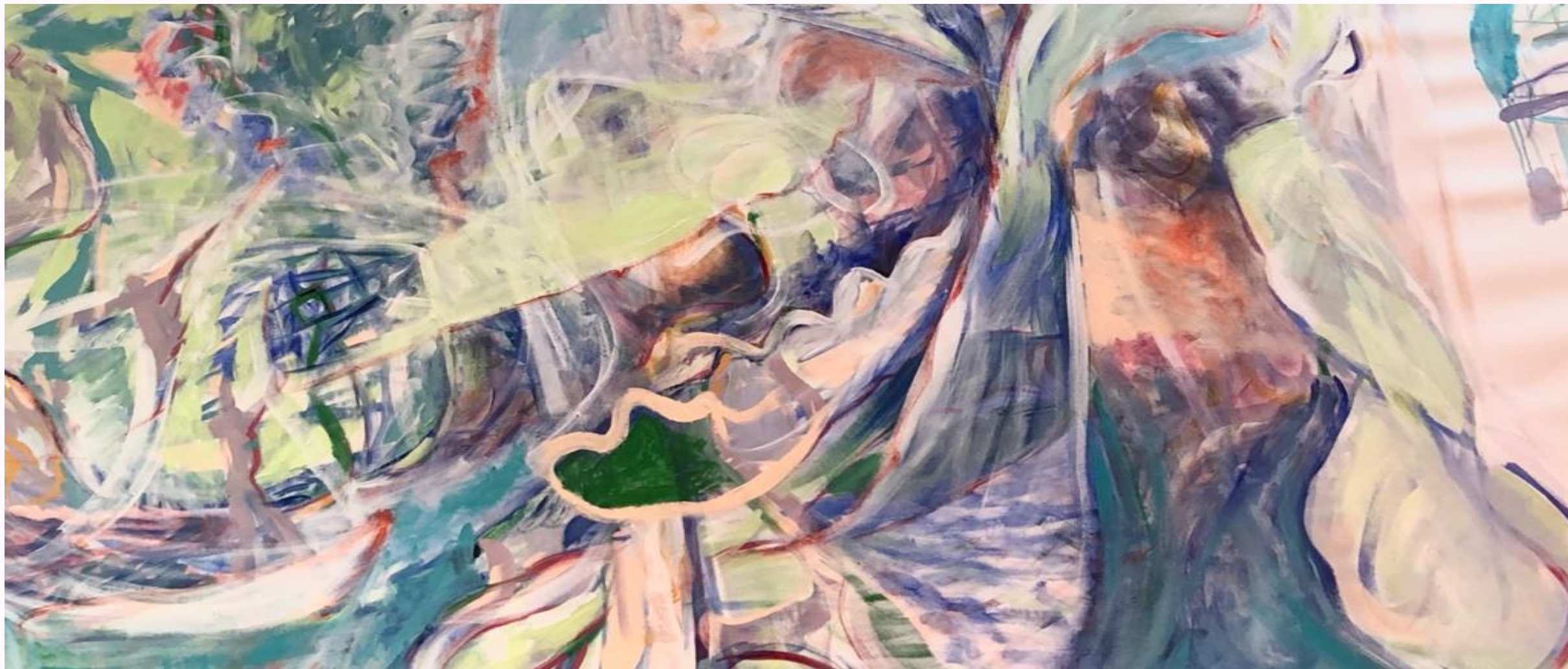
Peinture Acrylique sur toile de lin 2,50m x 2m 2015