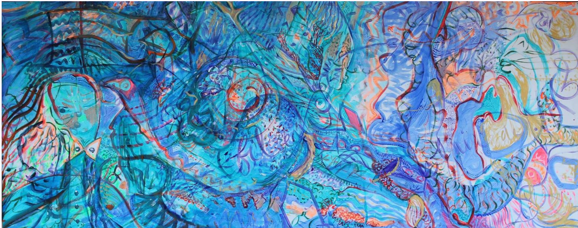
Série « Aquarius II » Peinture acrylique sur toile de lin 10m x 2m 2015